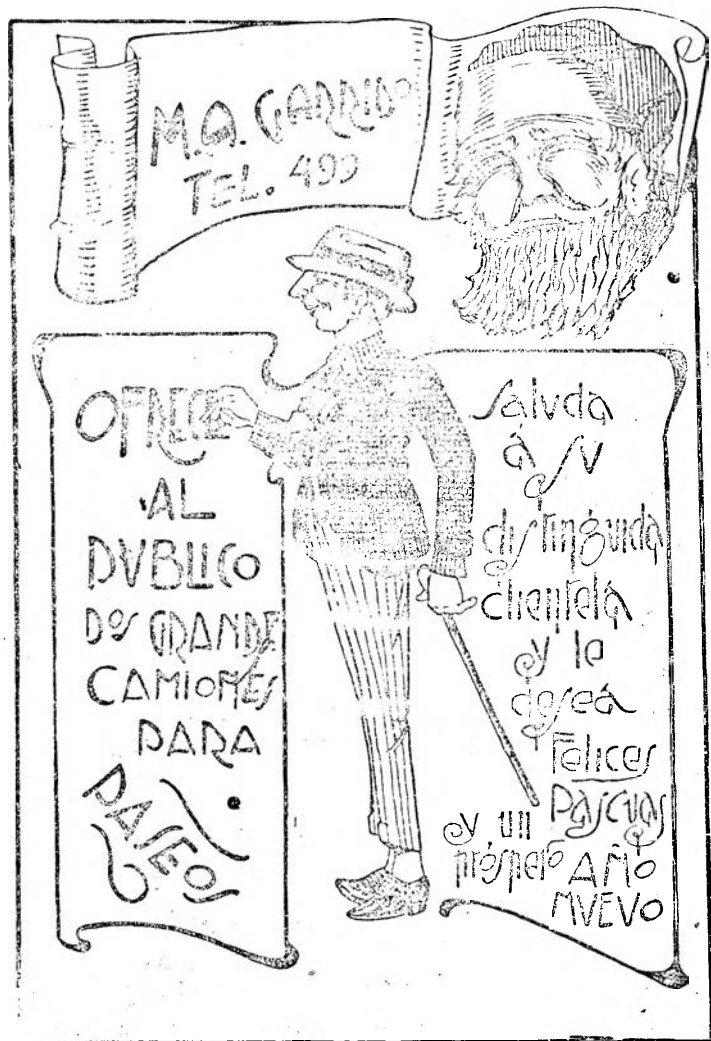
UNA VISTA MODELO